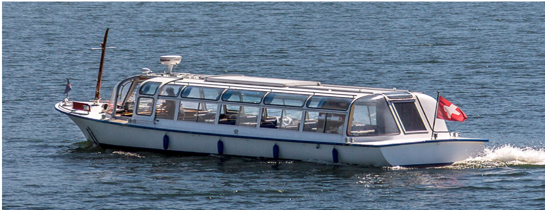
Die MS Angelika in voller Fahrt ... Sind Sie dabei?

Ein junges Unternehmen mit Vision sucht seine Sponsoren