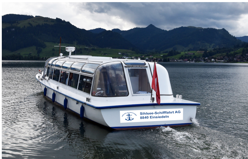
Ein (Haupt-)Sponsor am Heck