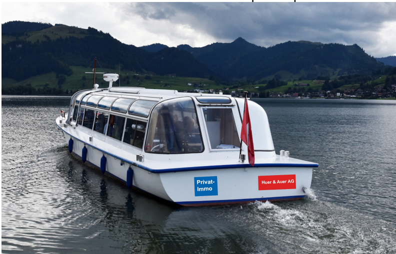
Maximum zwei Sponsoren am Heck

Ihre Werbebotschaft könnte sich zum Beispiel so präsentieren: